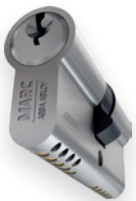
CIL E 1510